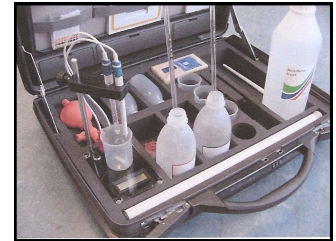
Analyseutstyr for klorider.

Faregrenser teknisk utstyr mht klorider.